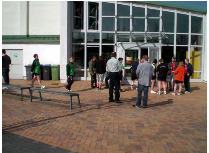
Eingangsbereich der Halle in Wolfsburg/Neuhaus bei schönstem Wetter !